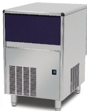
MODELOS ES - CON DEPÓSITO